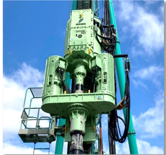
強化型HYSC機 電動オーガ